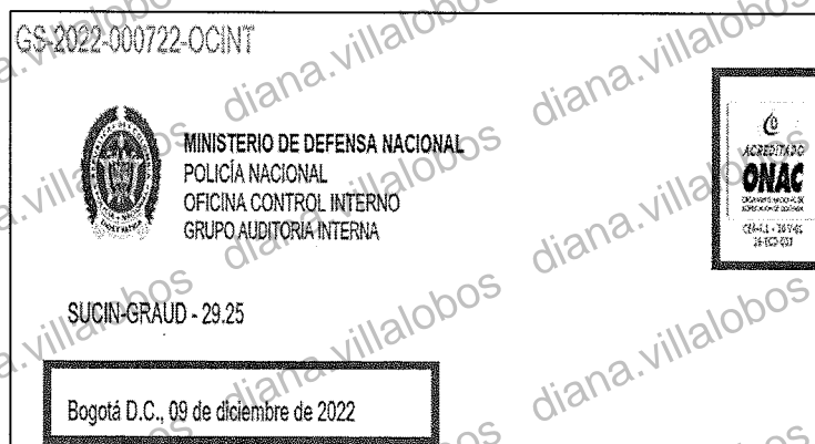
Imagen No1; cambio del logo de la certificación ONAC

Criterio: 1DT-CP-0001 DIRECCIONAMIENTO TECNOLÓGICO; 1DT-PR-0014 GESTIÓN DE CAMBIOS; 1DT-GU-0012 GUÍA PARA PRESTACIÓN DE SERVICIO CERTIFICADO DIGITAL O ESTAMPADO DE TIEMPO; Resolución No. 00894 del 12/04/2022 "Por la cual se expide el Manual del Sistema de Control Interno de la Policía Nacional de Colombia". Artículo 11. Primer aseguramiento del control. ISO 9001 2015 numeral 8.5.6 control de cambios.